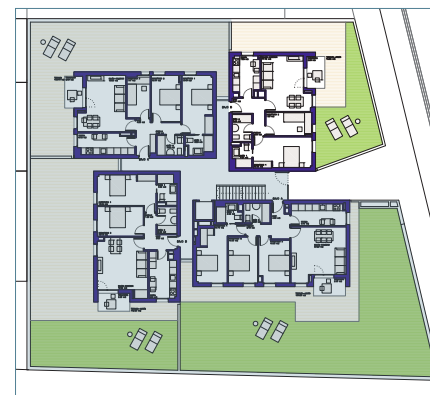
Plano planta Baja

SUPERFICIE ÚTIL TOTAL: 61,54 m 2 SUP. TOTAL CONSTRUIDA: 75,02 m 2 SUP. TOTAL CONSTRUIDA i/pp ZC: 86,23 m 2 SUP. JARDÍN/TERRAZA: 72,52 m 2