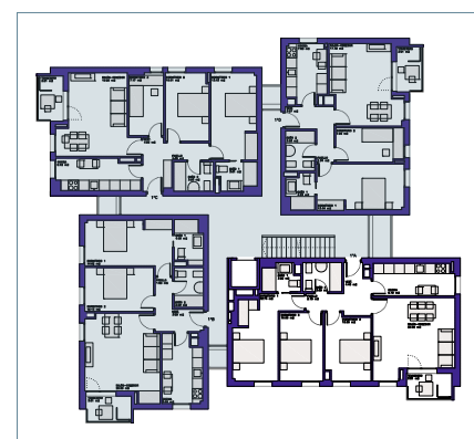
Plano Primera planta

SUPERFICIE ÚTIL TOTAL: 80,72 m 2 SUP. TOTAL CONSTRUIDA: 96,91 m 2 SUP. TOTAL CONSTRUIDA i/pp ZC: 111,39 m 2