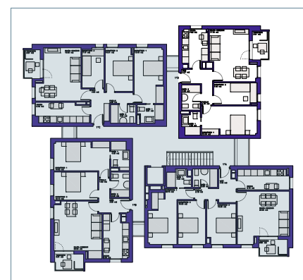
Plano Primera planta

SUPERFICIE ÚTIL TOTAL: 63,29 m 2 SUP. TOTAL CONSTRUIDA: 77,22 m 2 SUP. TOTAL CONSTRUIDA i/pp ZC: 88,76 m 2